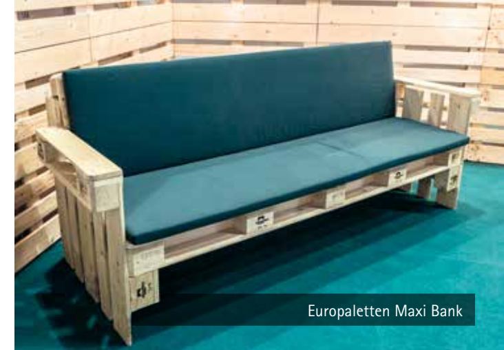
Europaletten Maxi Bank