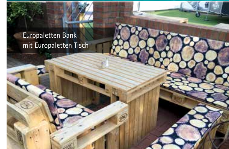
Europaletten Bank mit Europaletten Tisch