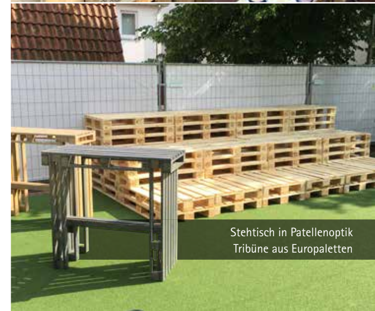
Stehtisch in Palettenoptik Tribüne aus Europaletten